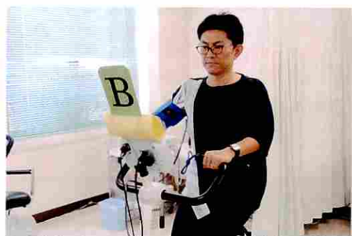
自転車エルゴメーター負荷試験